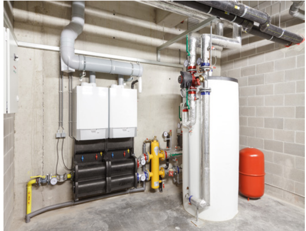
Remeha Quinta Pro in cascade in combinatie met een sanitair warmwaterbereider Remeha BP