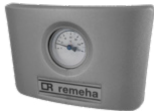
Temperatuur indicatie op Remeha BP

Elke solo verwarmingsketel (enkel verwarming) kan verbonden worden met de Remeha BP boiler en vormen zo een complete warmte- en warmwater energiecentrale. Alle eigenschappen van deze boiler zorgen er samen voor dat een hoog debiet aan sanitair warm water altijd voor u klaarstaat, voor uw hoogste comfort.