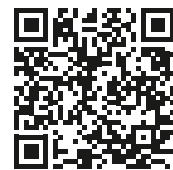
Demande d'entretien & des contrats d'entretien

Souscrivez dès aujourd'hui à un contrat d'entretien Remeha Service et dorénavant vous ne devrez plus vous tracasser pour la prise de rendez-vous pour l'entretien de votre chaudière. Notre équipe Remeha Service se chargera de l'entretien régulier de votre chaudière. Nous vous contacterons en temps et en heure pour planifier chaque entretien bien à l'avance et vous ferons parvenir par après les documents officiels. Ainsi, vous n'avez plus de soucis en la matière et vous pouvez continuer à profiter pleinement de l'eau chaude et de la chaleur bienfaisante de nos appareils.