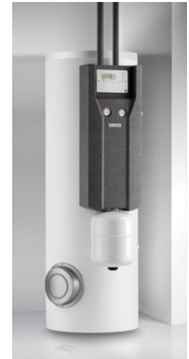
RemaSOL 200 Zonneboiler 200 liter

Een zonnestelsysteem werkt op basis van een zonnecring, drukgevuuld met warmtegeleidende vloeistof (glycol), die warmte overbrengt van de zonnecollectoren naar het water in de zonneboiler. De circulatie in deze kring wordt gestart door de pomp van het zonnestation. Deze wordt aangestuurd door de zonne-regeling in functie van de gemeten temperatuur in de zonnecollectoren en in de boiler.