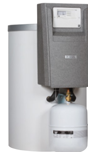
RemaSOL 150 Zonneboiler 150 liter