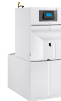
Remeha Lava Plus S E op boilermodule BS 160 ESL