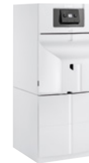
Remeha Lava Plus D op boilermodule BS 110 ESL

Door een optionele buitenvoeler bij te installeren wordt 5% extra bespaard op uw energiefactuur. Met de Remeha eTwist, iSense (met draad of draadloos) of qSense (draadgebonden) bediening wordt de installatie op elk moment van de dag vanuit uw woonkamer correct geregeld. Deze modulerende thermostaten maken van de Remeha Lava Plus een extra zuinige stookolieketel.