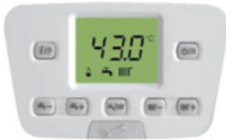
Digitaal bedieningsbord met verlicht en overzichtelijk display

De ruimtevoeler (thermostaat) is verkrijgbaar mét of zonder draad en werkt modulerend voor een uiterst efficiënte werking. Dankzij het LCD display en slechts 3 bedieningsknoppen programmeert u eenvoudig uw verwarming en warmwater wens.